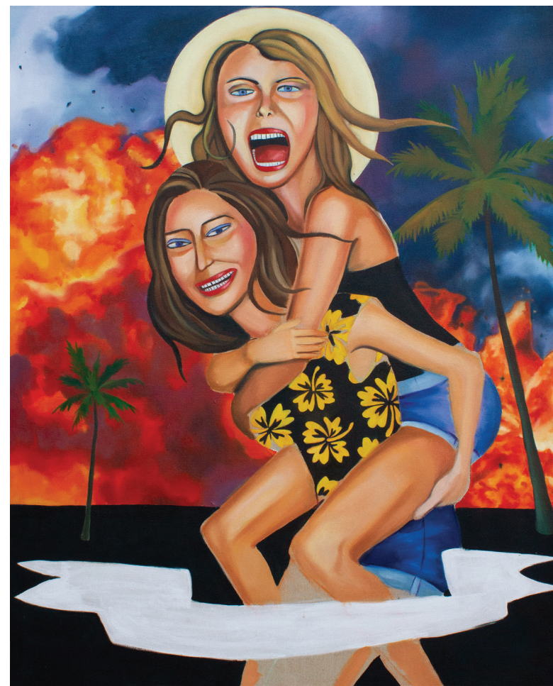
"Otmica Sabinjanki", 150 x 120 cm, ulje na platnu, 2020.