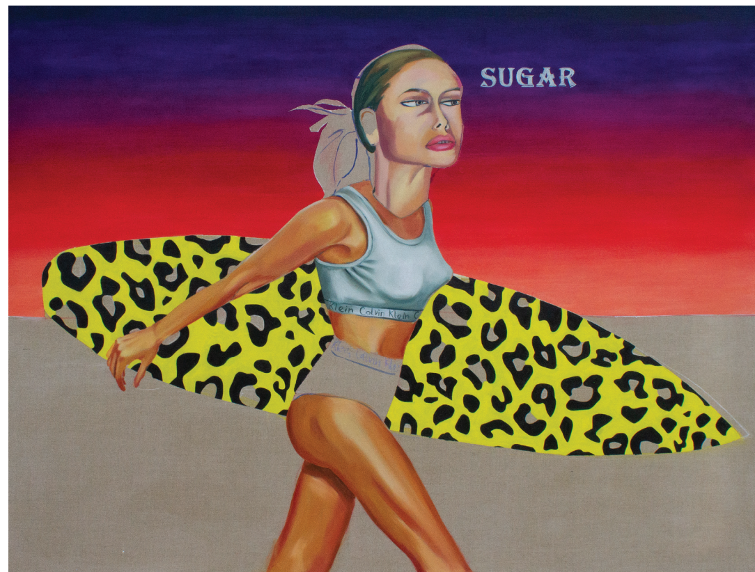
"Rođenje Venere", 150 x 200 cm, ulje na platnu, 2020.